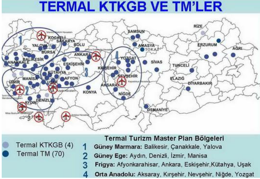
Şekil- 2: Termal Turizm Master Bölgeleri

Bu alanlar; Güney Marmara Termal Turizm Bölgesi (Çanakkale, Balıkesir, Yalova), Frigya Termal Turizm Bölgesi (Afonkarahisar, Kütahya, Uşak, Eskişehir, Ankara), Güney Ege Termal Turizm Bölgesi (İzmir, Manisa, Aydın, Denizli) ve Orta Anadolu Termal Turizm Bölgesi (Yozgat, Kırşehir, Nevşehir, Niğde) şeklindedir. Bu bölgelerin her birinin destinasyon merkezi olarak geliştirilmesi ve bu bölgeler içinde termal kaynaklı tesisler başta olmak üzere golf, doğa turizmi, su sporları vb. turizm türleri ile bütünleşmesi ve yakın çevredeki diğer kültürel ve doğal değerlerle de ilişkilendirilmesi hedeflenmektedir.