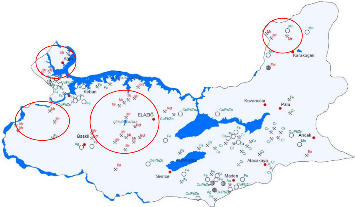
Harita 1: Elâziğ İli Maden Haritası