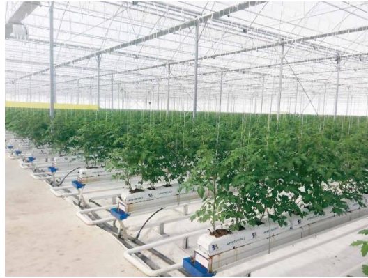
Şekil 11: Bitki Yetiştirme Yatakları

Bitki Yetiştirme Yatakları (Askılı Sistem): Kurulacak seralarda hidroponik (topraksız) tarım uygulaması yapılacaktır. Askılı bitki yetiştirme yatakları (katırlar) üzerinde cocopet (Hindistan cevizi lifi) veya rockwool (taşyünü) yetiştirme torbaları (growbag) kullanılmaktadır. Yetiştirme yatakları bir taraftan boyalı olup galvaniz 0,6 mm sacdan imal edilmektedir. Bant açılımı ise 60 cm'dir. Sistem seranın konstrüksiyon makaslarına asılmış vaziyettedir. Bu şekilde yapılacak tasarımla; drenajın düzgün çalışmasını, hem de katır altı hava sirkülasyonunun sorunsuz çalışması açısından birçok sıkıntıyı çözmektedir.