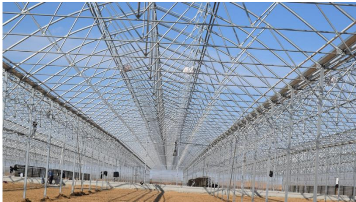
Şekil 4: Sera Gotik Tip Makas Yerleşimi Örneği

Makaslar: Makas tasarımı, diğer makas sistemlerinden farklı, rijit, yük dağılımı dengeli ve güçlüdür. Bu kapsamda, yükler alt başlıkta 5 eşit bölüme ayrılmış ve 10 adet örgü malzemesi kullanılarak yükler sisteme eşit ve dengeli dağıtılmıştır. Genelde bazı makaslarda 4, bazılarında 6 bazılarında en fazla 8 eleman kullanılmaktadır. Makasın en önemli statik özelliklerinden biride bağlantılar düğüm noktalarında birleşmekte ve yükler daha doğru dengelenmekte ve sönümlenmektedir.