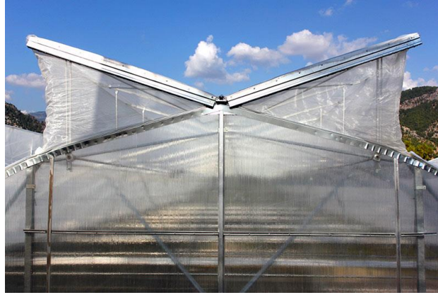
Şekil 8: Tül Örneği

Sinek Tülü: 40 mesh, 200 göz/cm 2 olup her pencerede ve havalandırmada kullanılmaktadır. Tuta Absoluta, Domates Güvesi (Kelebek), Yeşil Kurt, Prodenya, Beyaz Sinek, Galeri Sinek, Kırmızı Örümcek, Ehrips erginleri sera içine girmesini engelleyecek gözenekte olmalıdır. Bombus arılarının da sera dışına çıkmasını engeller ayrıca arı tülüne gerek yoktur. Biyolojik mücadelede kullanılan parazit ve predatörlerin sera dışına çıkışını önler.