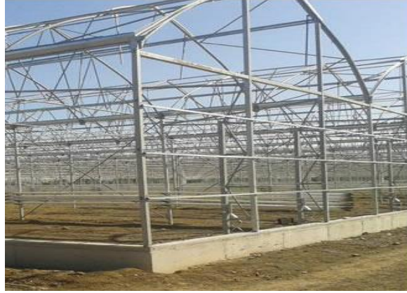
Şekil 3: Çevre Temel ve Yan Perde Betonunu

Çevre Temel ve Yan Perde Betonunu: Temel grov betonu 50x20 ebatlarında arazinin meyilini koruyacak şekilde sera çevresine verilen ölçülere göre yapılır. Bu beton içerisine 6 mm hasır donatı konularak betonun mukavemeti arttırılır.