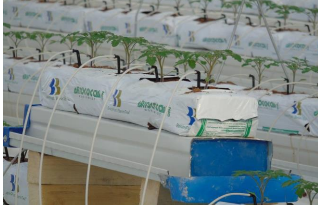
Şekil 12: Drip Sulama Sistemi

doğrudan güneş ışığını görmeyen, tercihen gutter'ın altında kalacak şekilde yerleştirilmelidir. Doğrudan güneş ışığı alması ve sulama suyunun sıcak yaz günlerinde ısınması, özellikle pythium, kök çürüklüğü gibi bazı hastalık etmenlerinin oluşumu için olumsuz ortam hazırlayacaktır. Sulama suyunun üretim ile ilgili sıkıntı çıkmaması için su sıcaklığının 15 OC'den daha düşük olmaması gerekmektedir.