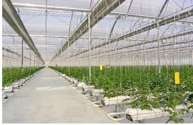
Şekil 10: Sera Askı Telleri

Bitki Askı Telleri: Sera içerisindeki en önemli ekipmanlardan biridir. Sağlam ve dayanıklı olmalı, kopmalara ve esnemelere karşı dirençli olmalıdır. Kopması durumunda tüm sıradaki bitkiler zarar görecektir. Tünel alınlarında, ön ve arka cepheleri boyunca 12mm'lik galvanizli halatlardan her kolona 4,5 m yükseklikte montaj yapılır. Her iç kolona sera eni yönünde 6 mm galvanizli halat bağlanır. Bu halatlar makaslara bağlanan 3 adet galvanizli zincire asılarak desteklenir. Bu halatların üzerinden her tünelde 6 sıra olmak üzere 4 mm galvanizli halat çekilerek bitki asma sistemimiz tamamlanır.