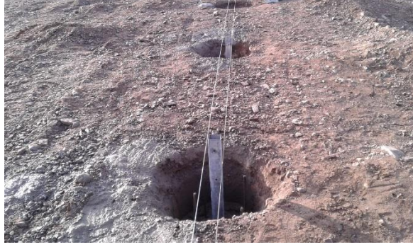
Şekil 2: Ankraj Çukuru Görşeli

Çevre Temel ve Yan Perde Betonunu: Temel grov betonu 50x20 ebatlarında arazinin meyilini koruyacak şekilde sera çevresine verilen ölçülere göre yapılır. Bu beton içerisine 6 mm hasır donatı konularak betonun mukavemeti arttırılır.