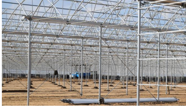
Şekil 5: Çelik Konstrüksiyon Elemanları

Çelik Konstrüksiyon Elemanları: Oval yay borusu, kolonlar, kolon oluk makas bağlantıları, vida ve civatalar, klipslerden oluşmaktadır. Taşıyıcı kolonlar seraların daha yüksek şekilde kurulmasını sağlar. Yüksek seralarda daha kolay iklim kontrolü sağlanırken, ihtiyaç olan gerekli yüksek havalandırma oranına ulaşılmasını sağlamaktadır. Teknik detaylar tercih edilen seraların özelliklerine göre değişmektedir.