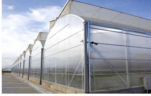
Şekil 7: Polikarbon Sera Yan Duvarları

Sinek Tülü: 40 mesh, 200 göz/cm 2 olup her pencerede ve havalandırmada kullanılmaktadır. Tuta Absoluta, Domates Güvesi (Kelebek), Yeşil Kurt, Prodenya, Beyaz Sinek, Galeri Sinek, Kırmızı Örümcek, Ehrips erginleri sera içine girmesini engelleyecek gözenekte olmalıdır. Bombus arılarının da sera dışına çıkmasını engeller ayrıca arı tülüne gerek yoktur. Biyolojik mücadelede kullanılan parazit ve predatörlerin sera dışına çıkışını önler.