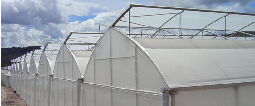
Şekil 6: Sera Havalandırma Örneği

Havalandırma Sistemi: Havalandırma sistemi her tünelde iki tane olacak şekilde konumlandırılmıştır. Havalandırmalar otomasyon ile kontrol edilecektir. Havalandırmaya sinek tülleri monte edilecektir. Sırtta bulunan motorlu havalandırma 2x250 şeklindedir ve ortalama olarak yer yüzeyinin %40'nı kaplar. Kelebek havalandırma 2.5x2 m ebadında ve açılma mesafesi de 1.5m'dir. Havalandırma 1.6 m uzunluğunda 2.5 mm kalınlığında dişli çubuklar tarafından ve pinyonlar tarafından yönlendirilir.