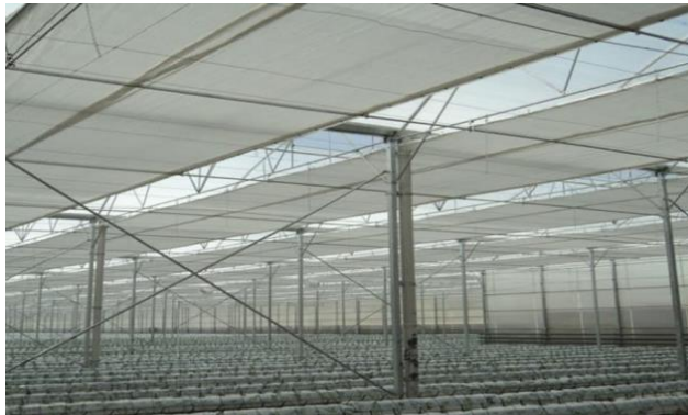
Şekil 9: Isı Perdesi Örneği

Isı Perdesi Sistemi: Bu perdeler yaz boyunca serinleme ve gölgeleme amaçlı kullanılırken kış boyunca da enerji tasarrufu sağlamaktadır. Bu malzemenin kullanımı üretim koşullarını iyileştirirken, diğer yandan, daha kaliteli ve yüksek ürün hasadı ile aynı zamanda dikkate değer bir şekilde yakıt tasarrufu sağlamaktadır. Genel olarak kış döneminde gün batımından sonra ani sıcaklık düşüşlerinde, sera içerisindeki ısının tavandan kaybolmasını engelleyen sistemlerdir. Genel olarak %25 enerji tasarrufu sağlamaktadır.