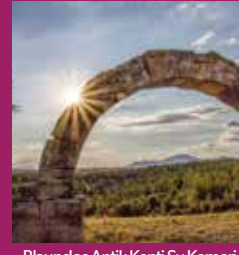
Blaundos Antik Kenti Su Kemerini

Aksaz Kaplıcası, Hamam Dere Kaplıcası, Tarihi İnay Hanı