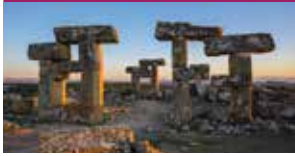
Blaundos Antik Kenti