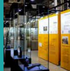
Uşak Kent Tarihi Müzesi