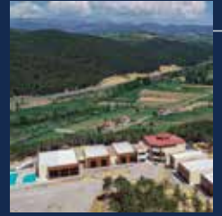
Hamamboğazı Termal Tesisi

* İlçede 1 adet Küçük Sanayi Sitesi bulunmaktadır.