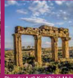
Blaundos Antik Kenti Büyük Mabedi