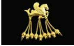
Karun Hazineleri Kanatlı Denizati Broşu