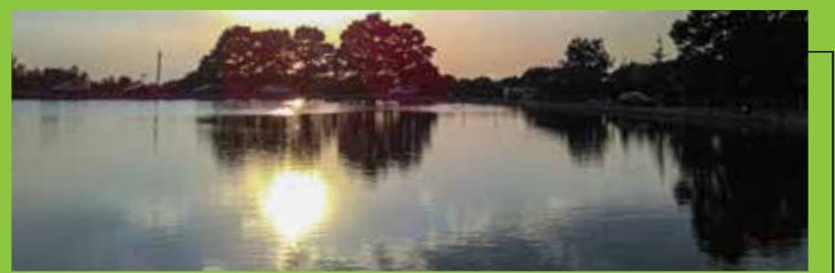
Evrenli Doğal Parkı

Sebaste Antik Kenti Sivaslı'nın önemli turistik yerlerindedir. İlçe merkezine 2 km uzaklıkta bulunan Selçukler beldesinde olan bu şehir Roma döneminden kalma bir yapıdır. Çıkarılan kazılar neticesiyle 1. derece sit alanı ilan edilmiştir. Buradan çıkarılan eserler Uşak, Afyonkarahisar ve İstanbul Arkeoloji Müzelerinde sergilenmektedir.