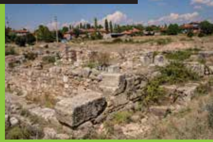
Sebaste Antik Kenti