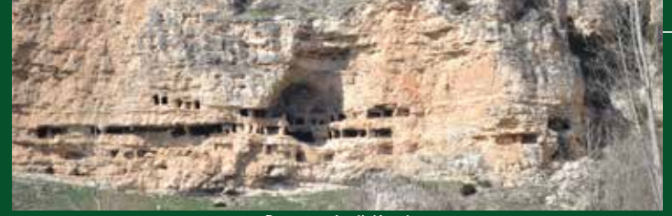
Pepouza Antik Kenti