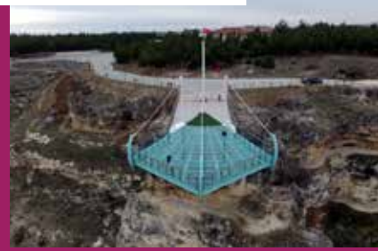
Ulubey Kanyonları Seyir Terası