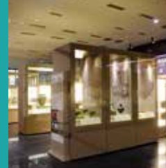
Uşak Arkeoloji Müzesi

Uşak'ın coğrafi işaretli, yöreye özgü doğal ve beşerî unsurlardan üretilen eşsiz lezzet