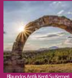
Blaundos Antik Kenti Su Kemerini

Aksaz Kaplıcası, Hamam Dere Kaplıcası, Tarihi İnay Hanı