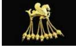
Karun Hazinesi Kanatlı Denizati Broşu