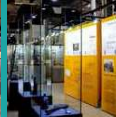
Uşak Kent Tarihi Müzesi