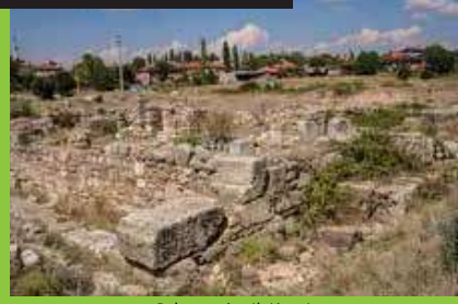
Sebaste Antik Kenti