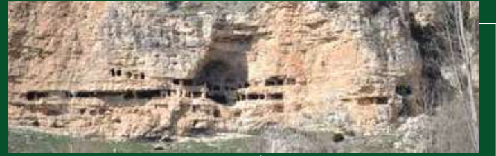
Pepouza Antik Kenti