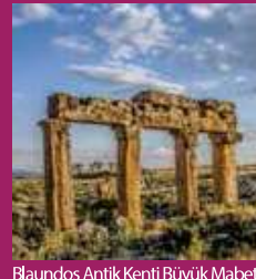
Blaundos Antik Kenti Büyük Mabedi