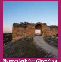
Blaundos Antik Kenti Güney Kapısı