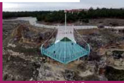
UlubeY Kanyonları Seyir Terası