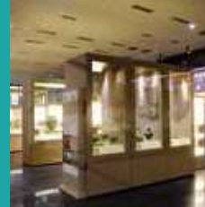
Uşak Arkeoloji Müzesi

Uşak'ın coğrafi işaretli, yöreye özgü doğal ve beşeri unsurlardan üretilen eşsiz lezzet