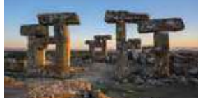
Blaundos Antik Kenti